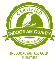
Indoor Advantage 認証試験

シックハウス症候群やアレルギー性皮膚炎の原因とされるホルムアルデヒド、トルエン、キシレンなどの揮発性有機化合物の削減を進めています。快適さと強度を追求しながら、同時に環境負荷の低減を実現しました。